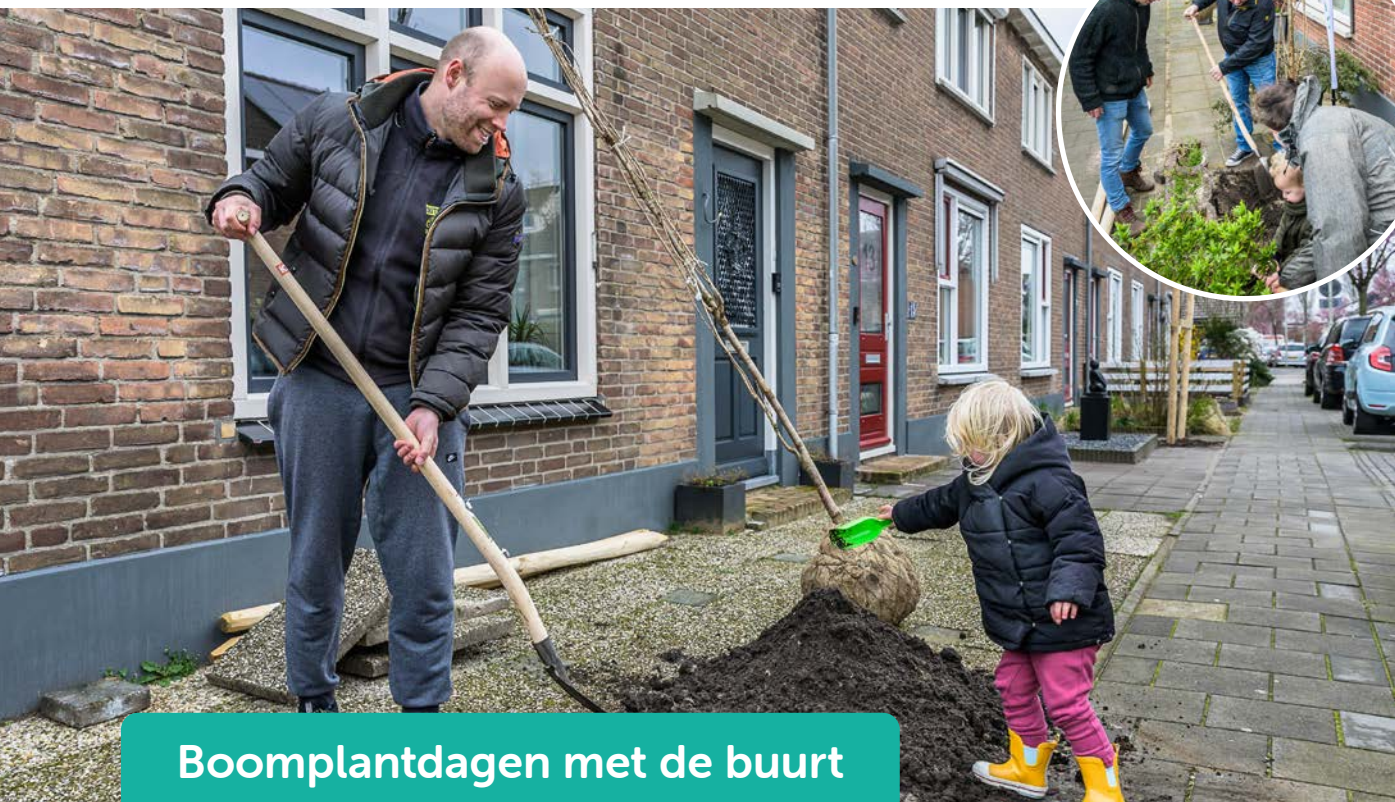
Boomplantdagen met de buurt