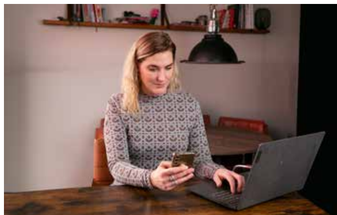
Aanmelden voor MijnVelison is makkelijk